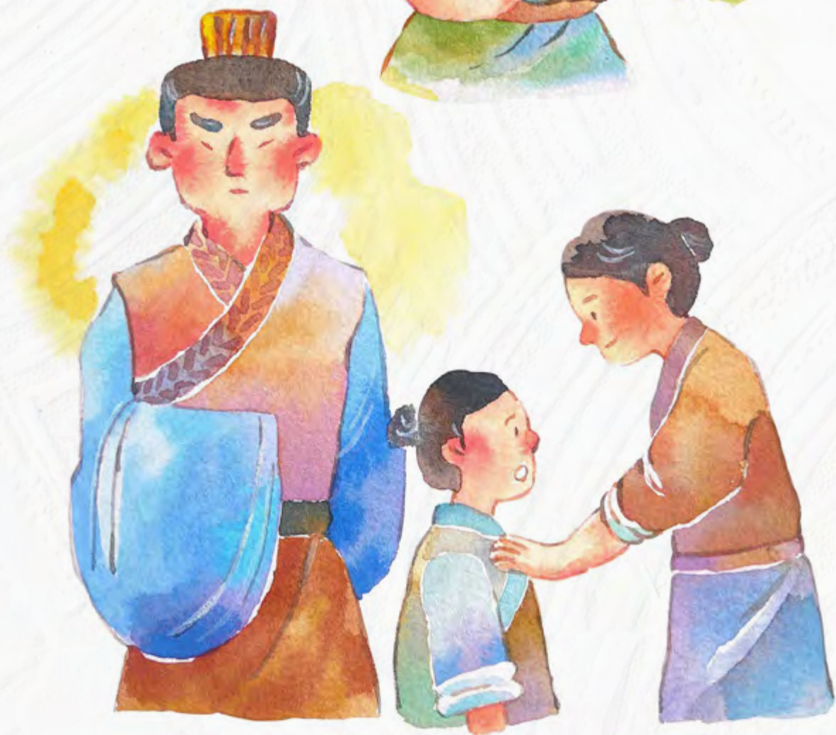
恭录自蔡礼旭老师《小故事大智慧》