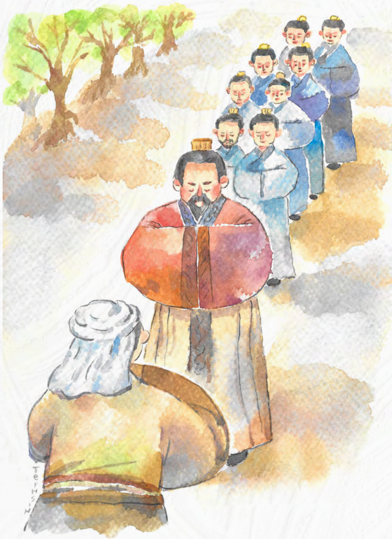
恭录自蔡礼旭老师《小故事大智慧》