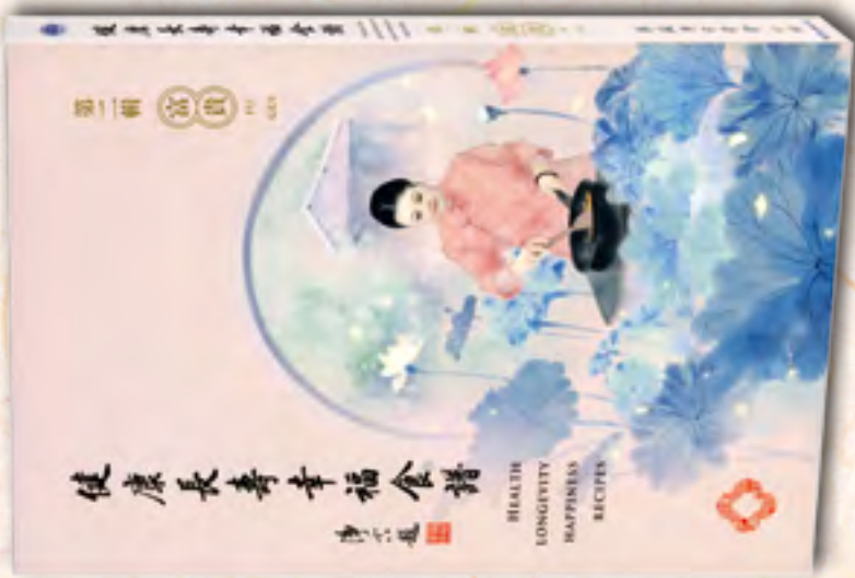
健康長壽幸福食譜 第二輯 富貴