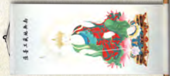
南無地藏王菩薩坐像 中幅 (邱老師繪製)