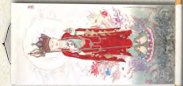
南無地藏王菩薩立像 中幅 (江老師繪製)