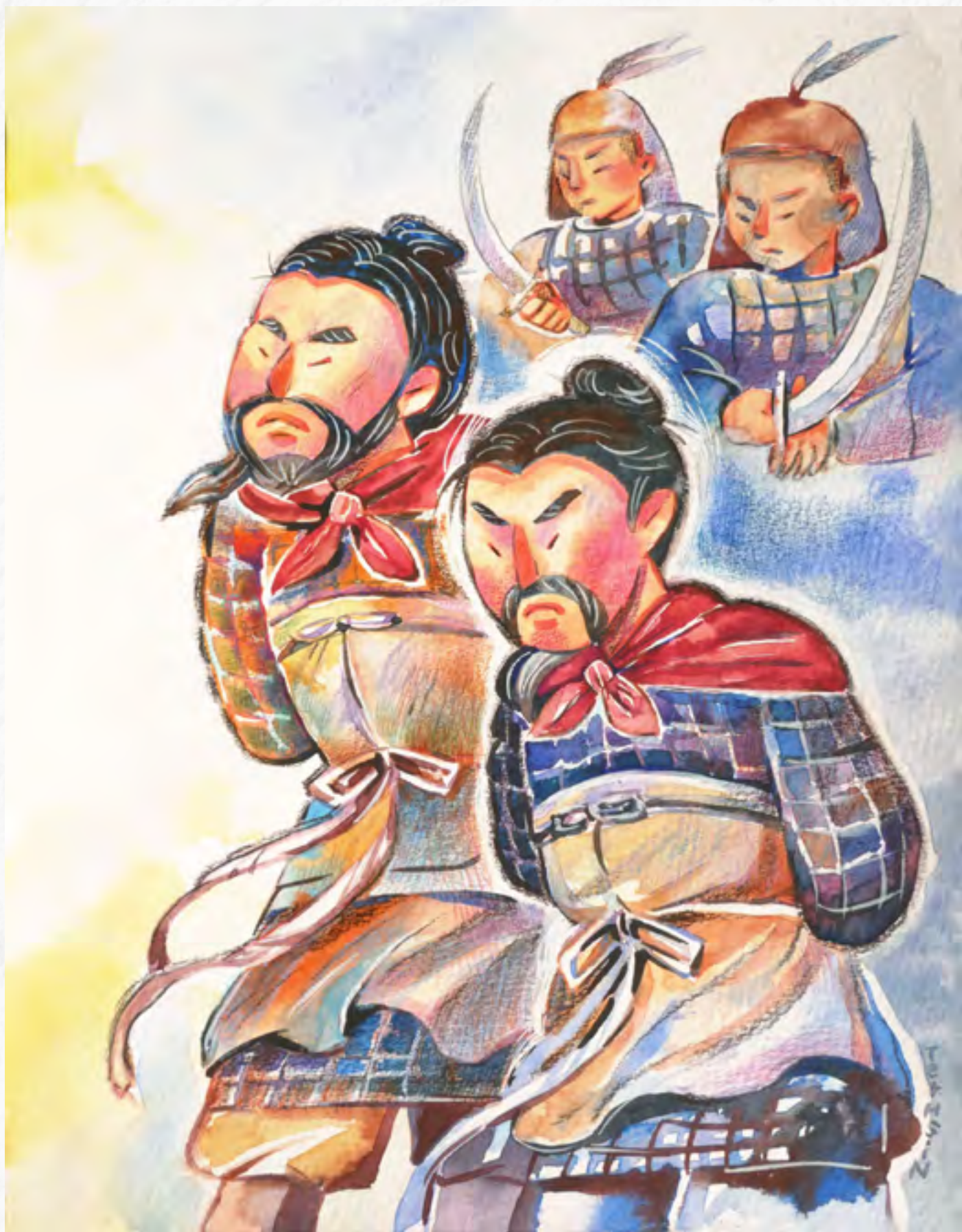
恭录自蔡礼旭老师《小故事大智慧》