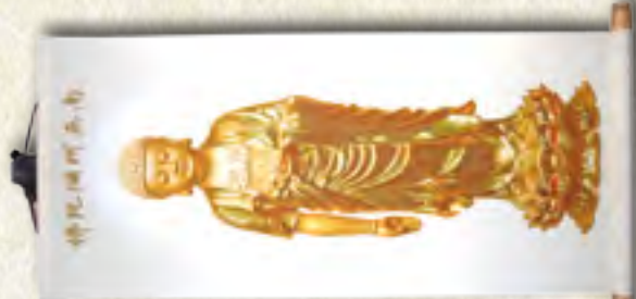
黃底金色 阿彌陀佛 中幅