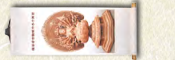
南無 千手千眼 觀世音菩薩 小幅