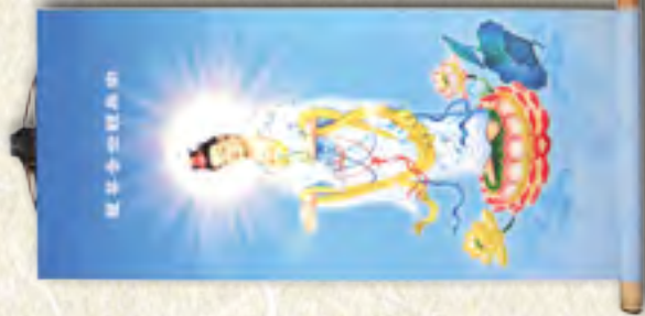
蓮花觀世音菩薩 中幅