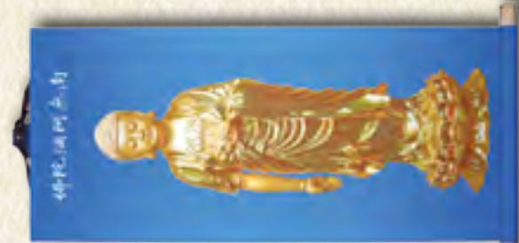
藍底金色 阿彌陀佛 中幅