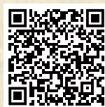
祭祖的意義 CH59-004-01 尺寸