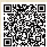
慎終追遠 民德歸厚 甲午年 冬至祭祖 HZ43-14-01 尺寸