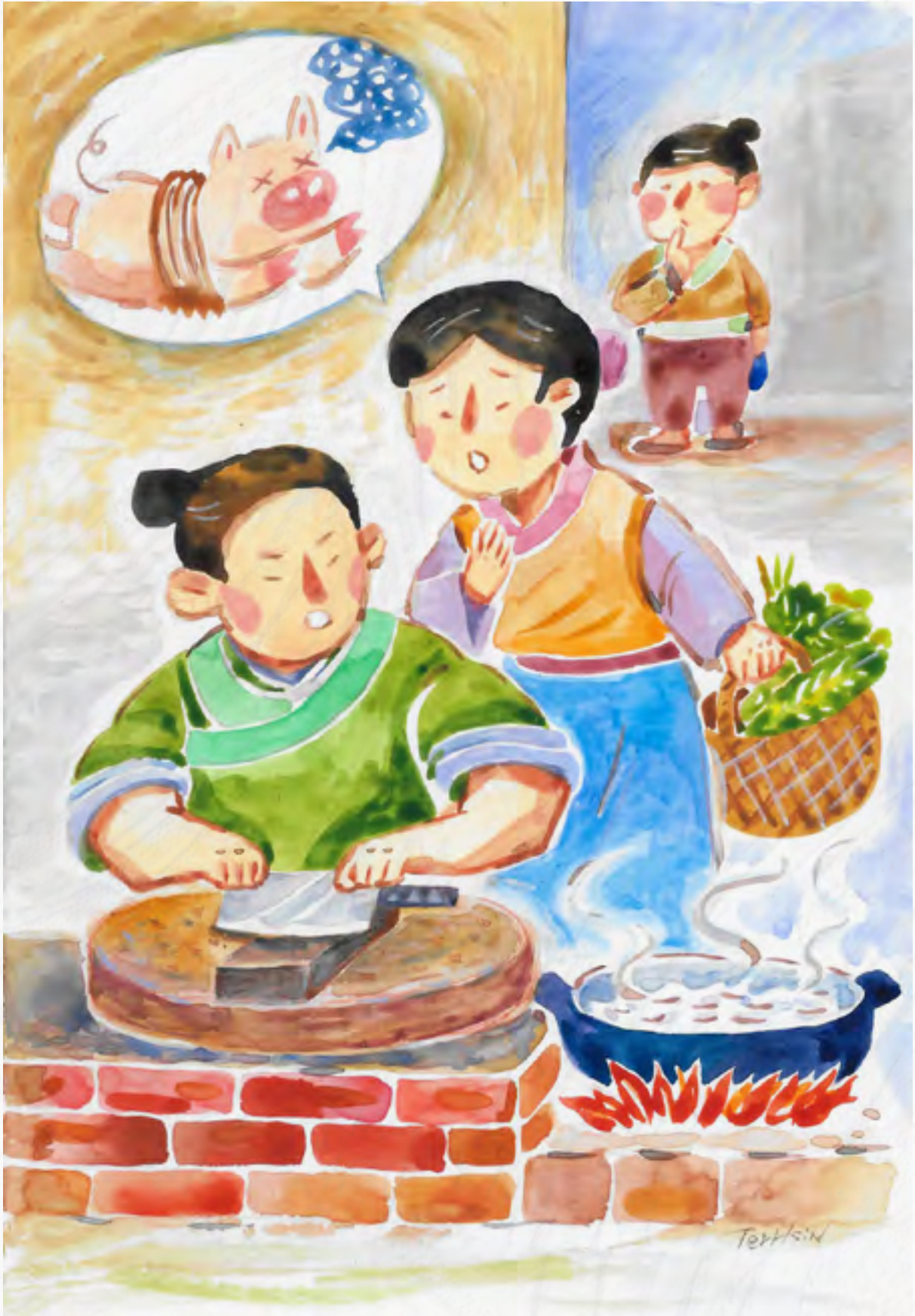
恭錄自 蔡禮旭老師《小故事大智慧》