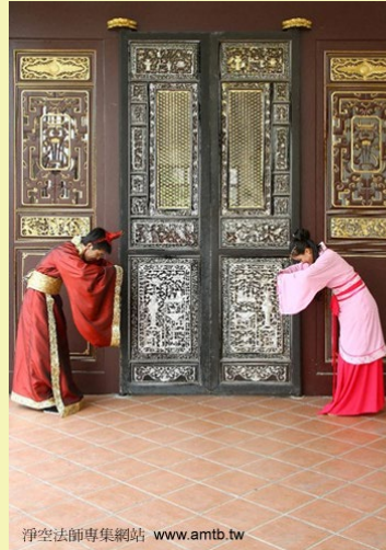
淨空法師專集網站 www.amtb.tw